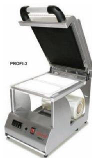
Termoselladoras de barquetas