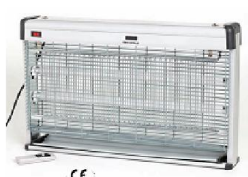
Exterminador de insectos