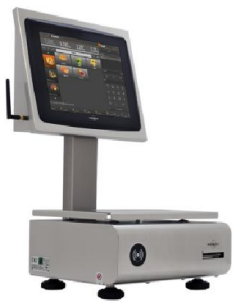
Balanza Tactil BM5 XS 12,1 “ Inox.

¿Estás pensando en montar una charcutería o tienda Gourmet? ¿Sabes la maquinaria que necesitas? Esta es la maquinaria y el utillaje que aconsejamos: