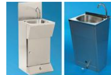
LavamanoInox con pulsador o pedal