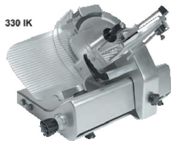
Cortadora de Fiambres