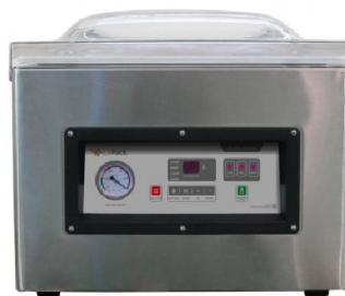
Envasadora al vacío