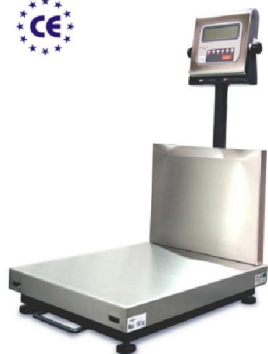
Báscula Plataforma + Visor hasta 600 kg