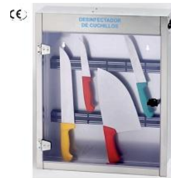
Armario esterilizador cuchillos